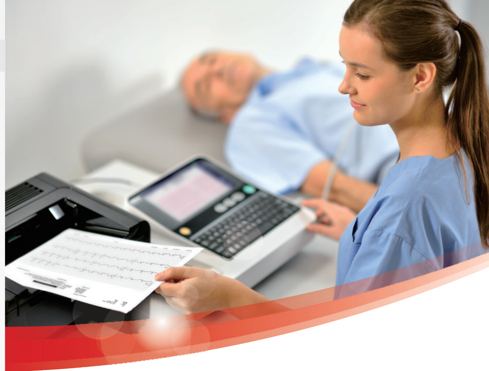
BeneHeart R12 Electrocardiógrafo

Las innovaciones en R12 se centran en mejorar la calidad de la atención sanitaria, aumentar la eficiencia operativa y reducir los costes del usuario mediante una solución compacta y asequible