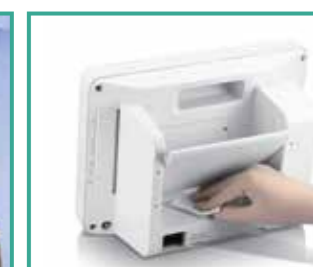
Compatible con múltiples agentes de limpieza