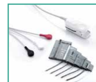
Accesorios de alta calidad