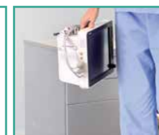
Protección contra caídas